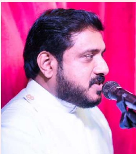
Kala Sandhya Presidential Address