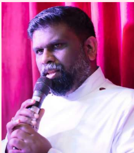
Kala Sandhya Inauguration